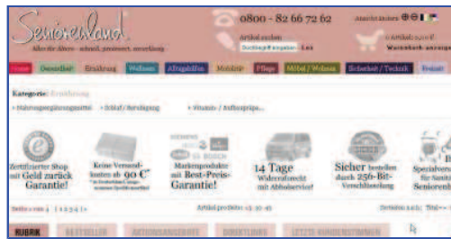
Ausschnitt einer Rubrikenseite im Seniorenland