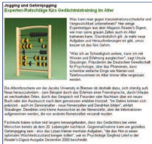
Detailseite der Serviceseiten50plus

Die Serviceseiten50plus sind zwar sehr übersichtlich aufgebaut, sprechen die älteren Nutzer jedoch zu wenig an. Die Farbgebung wirkt etwas fahl und wenig einladend. Zudem finden sich auf den Seiten teilweise lange Fließtexte, die wenig lesefreundlich gestaltet sind. Wichtig wären hier vor allem Zwischenüberschriften, Aufzählungszeichen und Hervorhebungen.